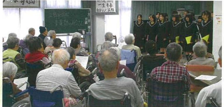
三島北高校音楽部