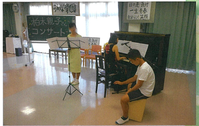
まるバンド演奏(6月11日)