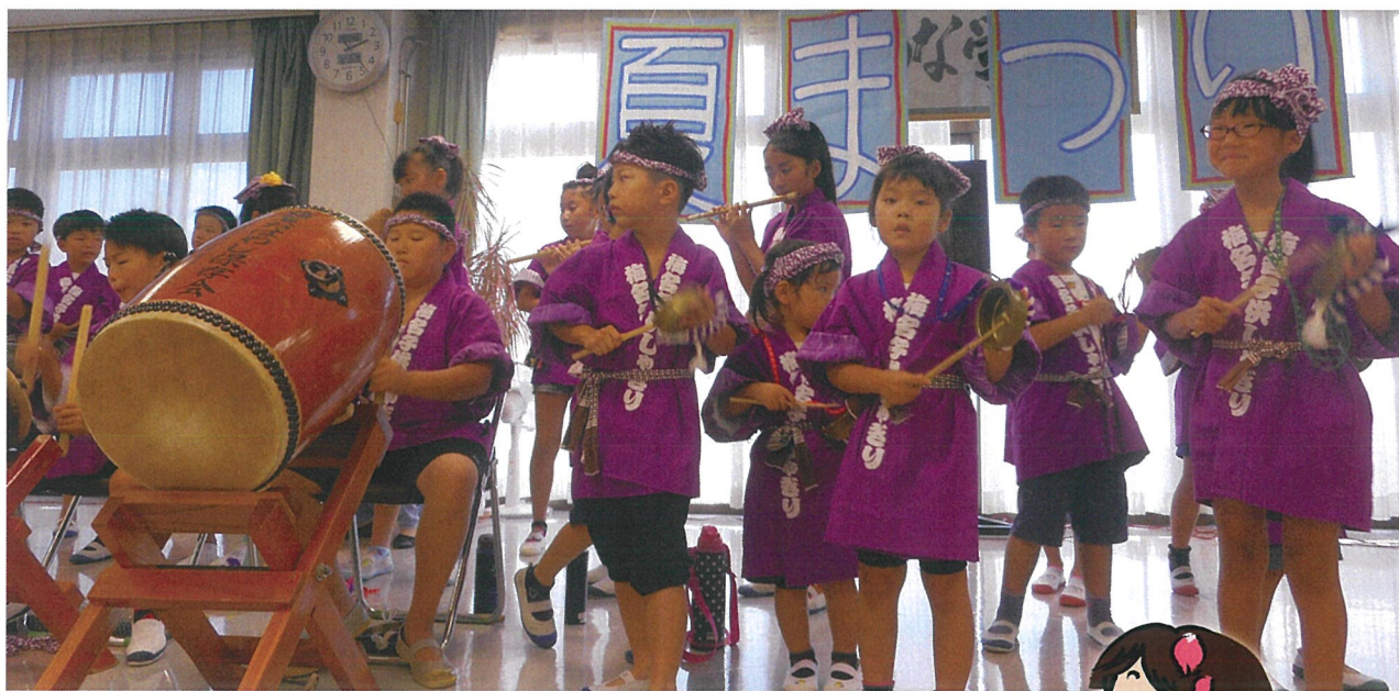
8月6日(土)梅名の里 夏祭り