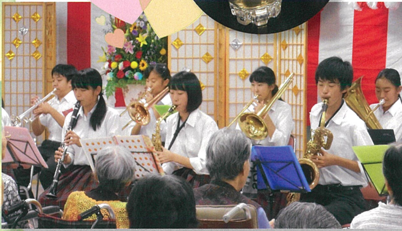
三島南中学校ブラスバンド部