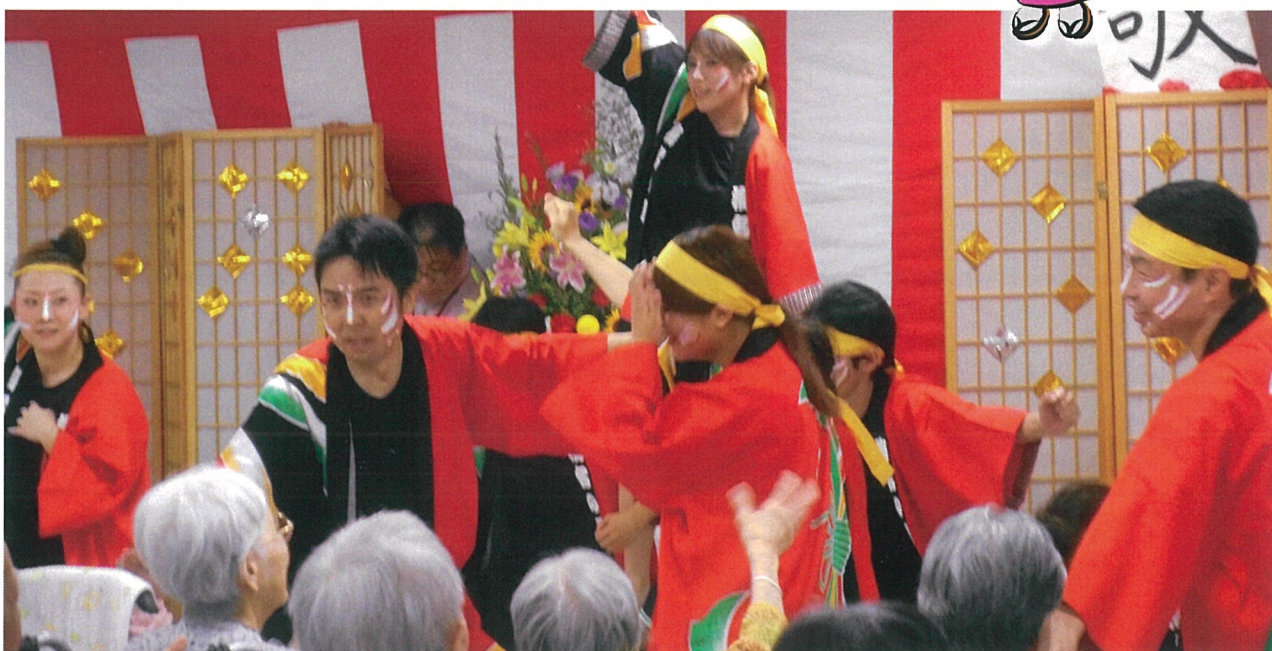
9月19日(月)梅名の里 敬老会